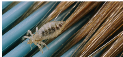
Hoofdluis op een kam.